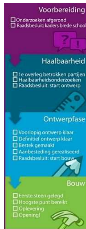
Figuur 2.1 fasering project

Per wijk is vastgesteld wie de kernpartners van de brede school zijn. 13 Met de partners is in een samenwerkingsovereenkomst vastgesteld op welke wijze men met elkaar samenwerkt en wie waar voor verantwoordelijk is. Het vaststellen van deze samenwerkingsovereenkomsten was ook een randvoorwaarde van de raad voor de ontwikkeling van de brede scholen. In het projectplan is de samenwerking vertaald naar een werkwijze, verantwoordelijkheden en een organigram (zie voor een nadere beschrijving en het organogram paragraaf 2.2).