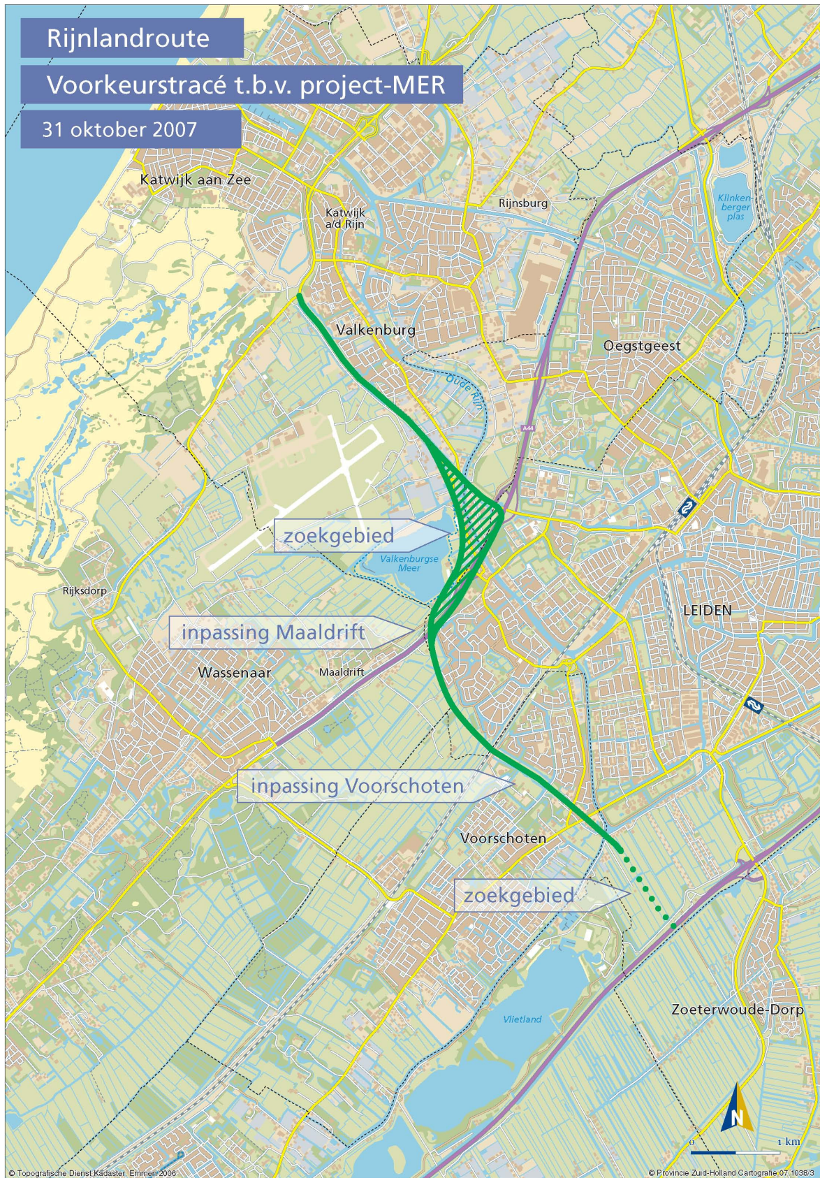
Figuur 1: Voorkeurstracé van de Stuurgroep RijnlandRoute d.d. 31-10-2007