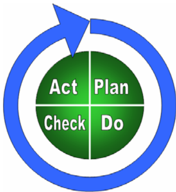
Figuur 5.1: Planning & Control-cyclus.