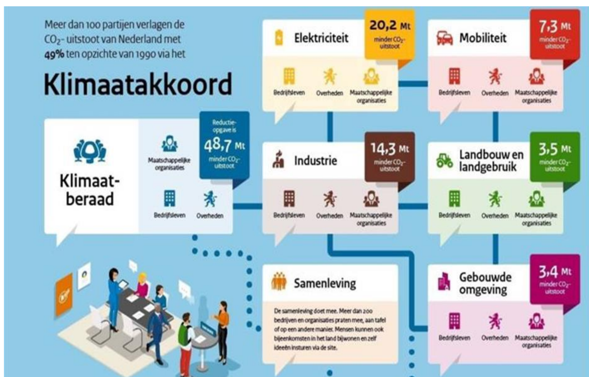
Figuur 2: klimaatakkoord en de opgave voor 2030 in een oogopslag

In bijlage 1 zijn de verslagen van de werkconferenties van 9 januari 2020 en 5 maart 2020 opgenomen. In bijlage 2 is een lijst met geraadpleegde stukken en geïnterviewde personen opgenomen. Deze vormen de basis voor deze rapportage. Verslagen van de interviews zijn in het bezit van de rekenkamercommissies en maken deel uit van het onderzoeksdossier. Omwille van vertrouwelijkheid zijn de verslagen niet opgenomen in het rapport.