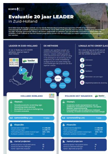
Figuur 3 Voorbeeld infographic